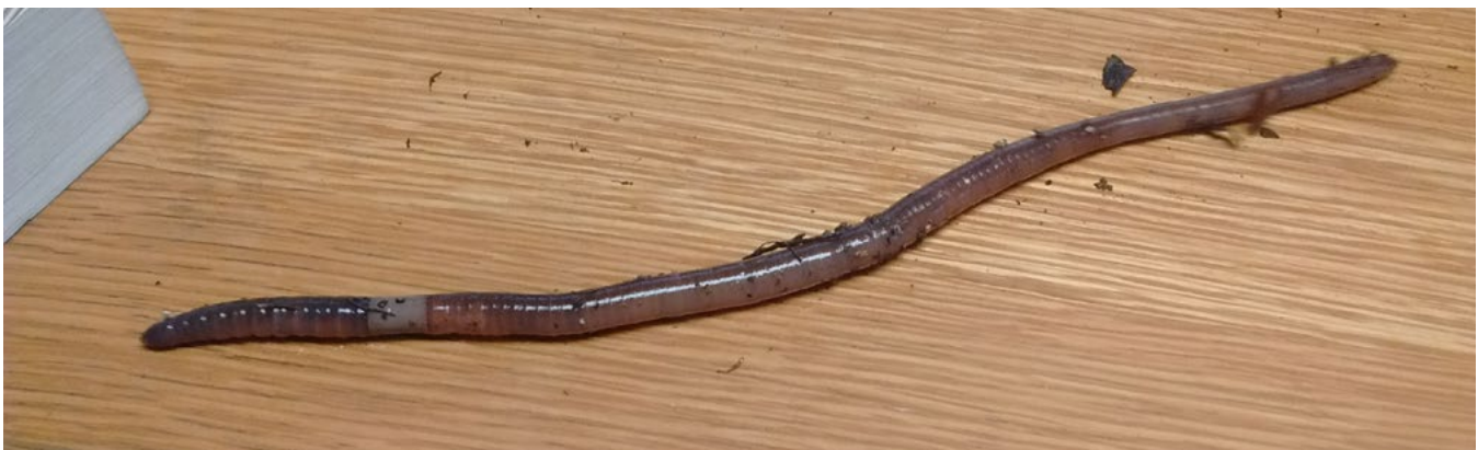
Fig. 1. Un gusano saltador adulto que se entregó en una Oficina de Extensión de la Universidad de Illinois para la identificación.