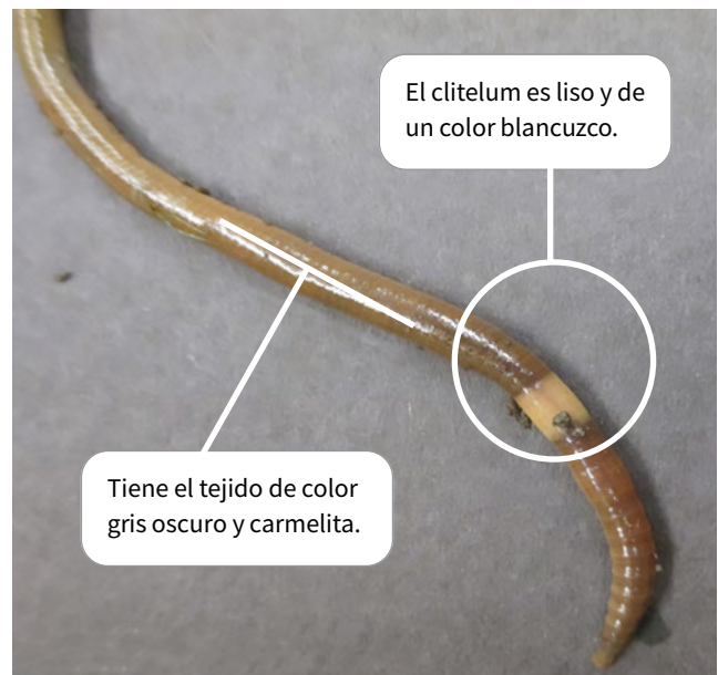
Fig. 2. Los gusanos saltadores tienen un cuerpo liso y oscuro, con un clitelum de color claro que los rodea y que no es elevado como en los otros gusanos.

Saque varias fotos del gusano que sean claras y bien iluminadas, y que incluyen algunas tomas en primer plano del clitelum (la banda), para informar sobre las observaciones de los gusanos en los condados en Illinois sin confirmar (consulte el mapa en la página 3). Apunte el condado y el ambiente donde se encontró el gusano. Incluya los detalles, como la cantidad de gusanos saltadores que encontró o si la tierra estaba afectada. No se tiene que entregar el espécimen físico.