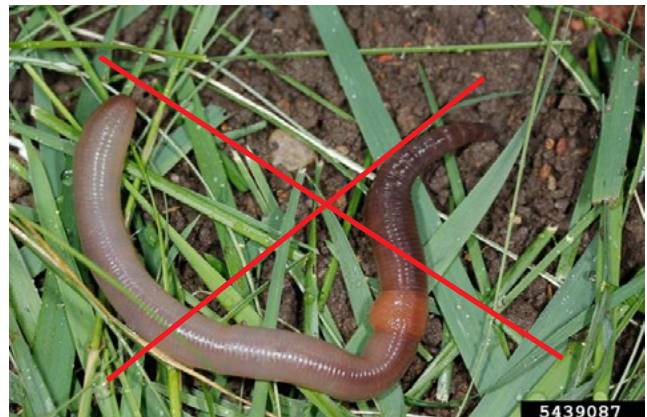
Fig. 3. Lombrices de tierra comunes ( Lumbricus terrestris ) son de color rojo-carmelita con un clitelum elevado.