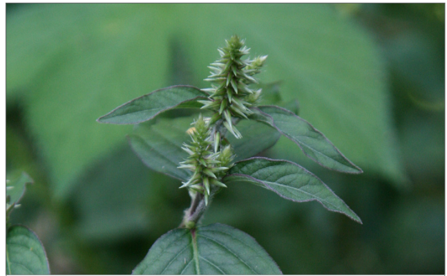
Fig. 6. Las flores son verdes y se organizan en una espiga (que parece a un limpiabotellas) que se alarga mientras se desarrollan las semillas.

Lee y sigue todas las instrucciones de la etiqueta cuando usa el herbicida. Se debe tener cuidado para evitar los impactos no deseados. Cuando aplique los herbicidas cerca del agua, usa formulaciones etiquetadas para el uso acuático. Los siguientes herbicidas han demostrado ser eficaces para controlar la flor de paja japonesa: éster 2,4-D, amina triclopir, glifosato, aminopiraldida, una mezcla de triclopir y fluroxipir, y una mezcla de aminopiraldida y metsulfurón.