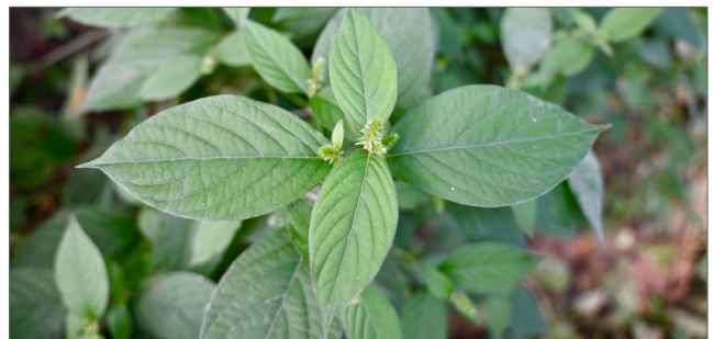
Fig. 4. La flor de paja japonesa tiene hojas opuestas con márgenes lisos y la nervadura prominente.