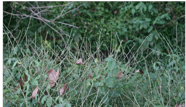
Fig. 7. Las semillas de la flor de paja japonesa se desarrollan en largas espigas de color marrón que persisten durante el invierno.