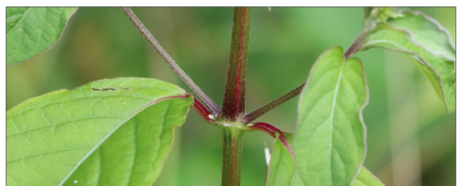
Fig. 5. Los tallos son cuadrados y con frecuencia tienen un color rojizo, especialmente en los nodos.