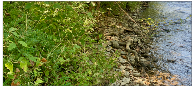
Fig. 3. La propagación inicial de la flor de paja japonesa generalmente continúa a lo largo de las orillas de los ríos, pero también puede extenderse a los hábitats de las tierras altas.