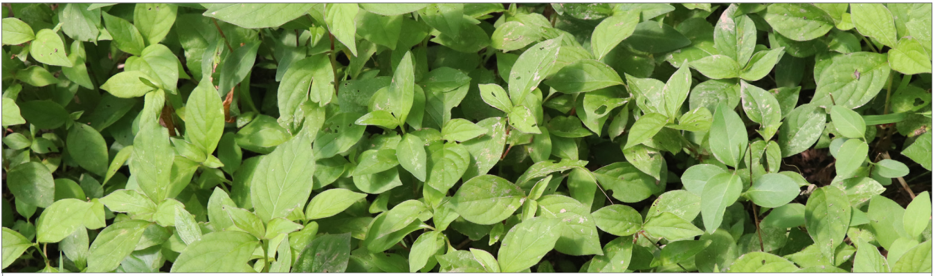
Fig. 9. Plantas inmaduras, pre-reproductivas.