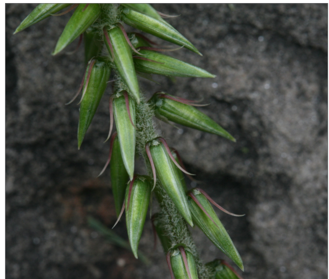
Fig. 8. Las brácteas rígidas en la base de las semillas les permiten adherirse al pelo de los animales y a la ropa, lo que facilita el transporte accidental de la flor de paja japonesa. Crédito de la foto: Chris Evans, University of Illinois

Crédito de la foto: Chris Evans, University of Illinois