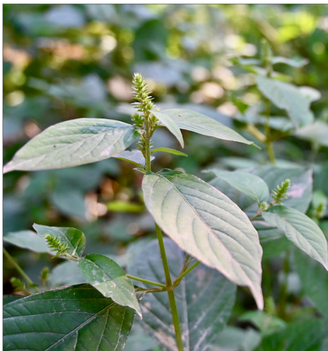
Fig. 1. La flor de paja japonesa puede formar un rodal denso, desplazando a otras especies de plantas.

La flor de paja japonesa es una planta perenne herbácea que crece densamente, desplazando a otras especies de plantas. (Fig. 1). Los científicos y los administradores de tierras están preocupados sobre la flor de paja japonesa a causa de la velocidad con la que se hace cargo después de llegar a un área. La planta forma los monocultivos densos en los hábitats ribereños sensibles (Fig. 1) que impactan negativamente la diversidad y la regeneración de las plantas nativas, así como el hábitat para otras especies y la calidad del agua.